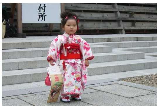
Shichi-go-san Fest am Izuma-Taisha (Foto: K.S.Schmidt), November 2008)

Herbststürme wehen Wolken schütten Regen aus Ich trotze dem Wind. Haiiku von Renate Huldshinsky