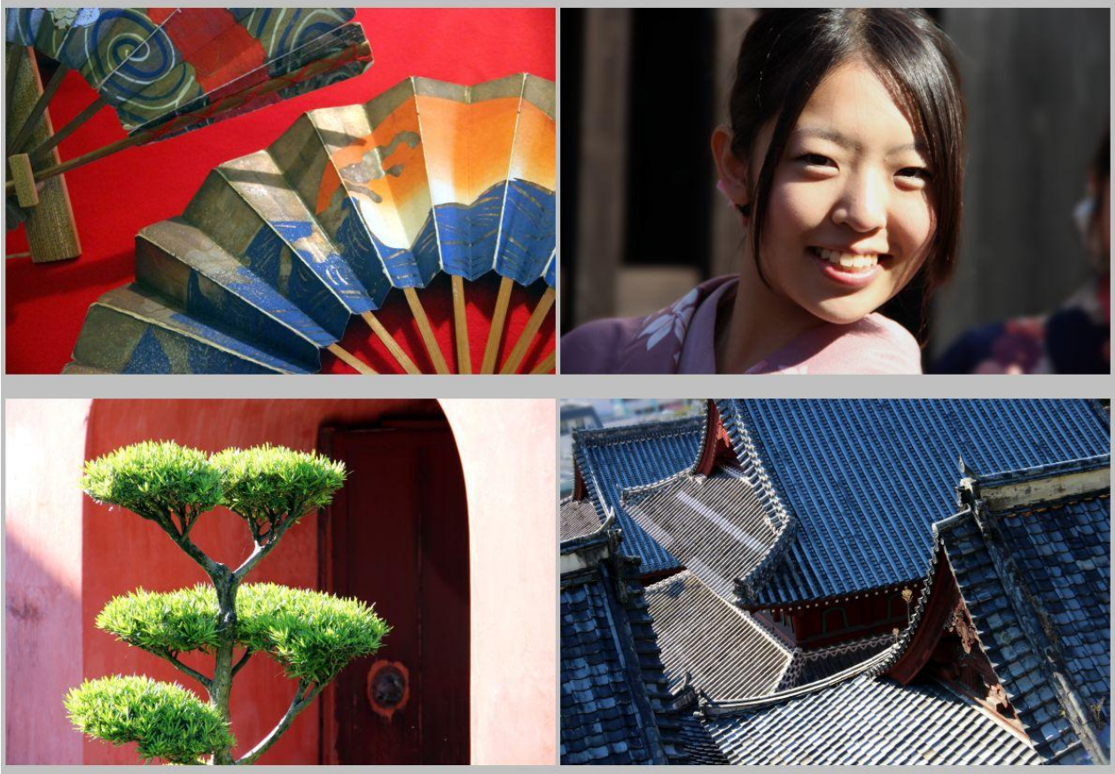
Madame Butterfly von heute und Tempeldächer des Sofuin