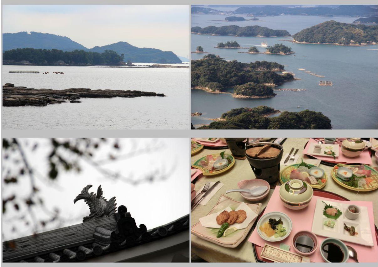
Die 99 Inseln und Dinner in Hirado