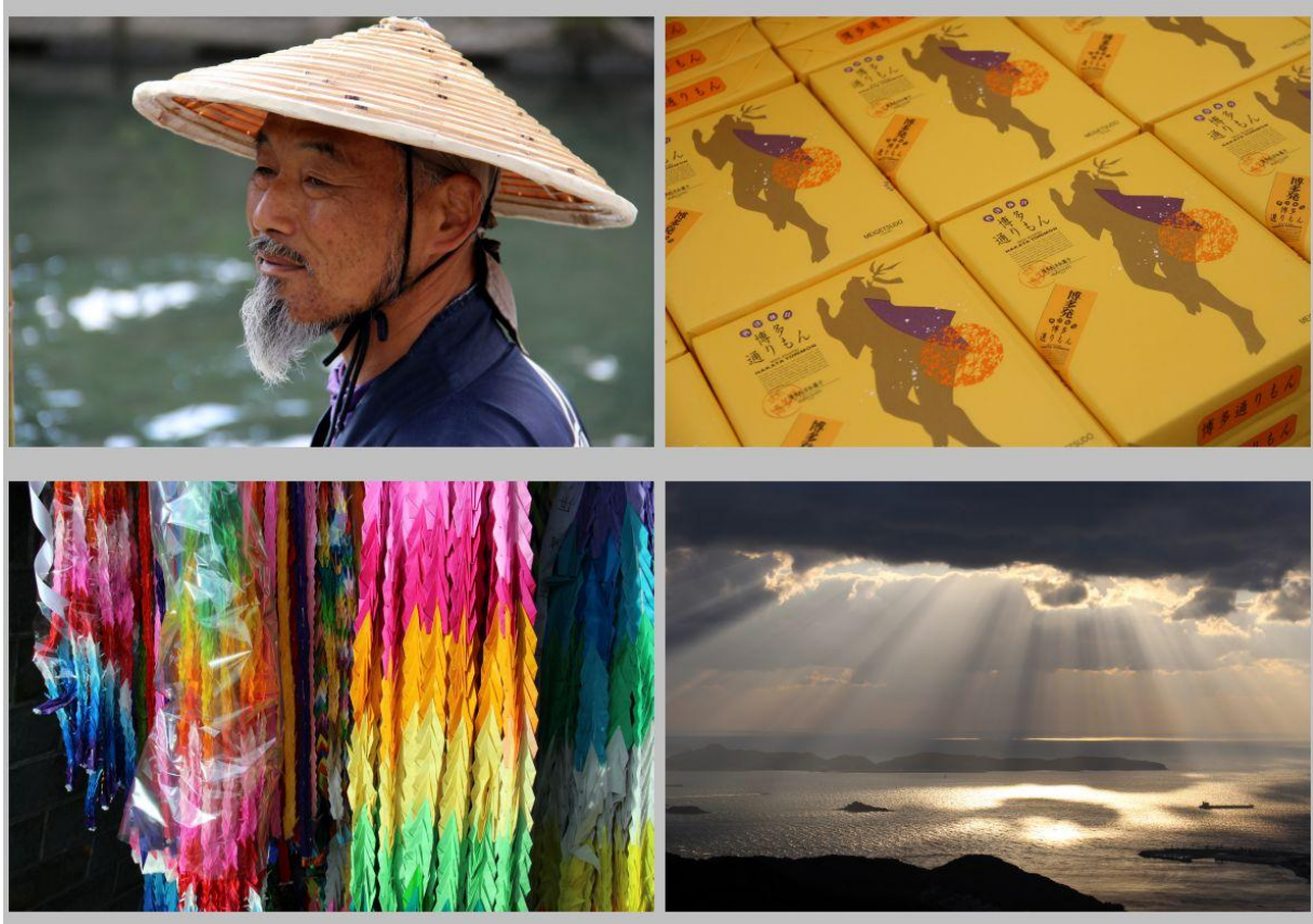
Yanagawa und Meer bei Nagasaki

Einen Stopp in Yanagawa nutzten wir zu einer Bootsfahrt durch die vielen Kanäle und erfreuten uns an den schmucken Häusern, Boutiquen und kleinen Cafes. Da es an dem Tag ziemlich frisch war, gab es schon mittags ein Glas des lokal gebrannten Sake. In Nagasaki standen auf dem Programm: Friedenspark, Atombombenmuseum, die katholische Kirche O-ura, Glover Garden, der Glover-Garten (ein Freilichtmuseum mit Villen bedeutender Westler, die Japan bei der Industrialisierung geholfen haben) und Dejima, die Enklave für holländische Kaufleute im 17. Jahrhundert.