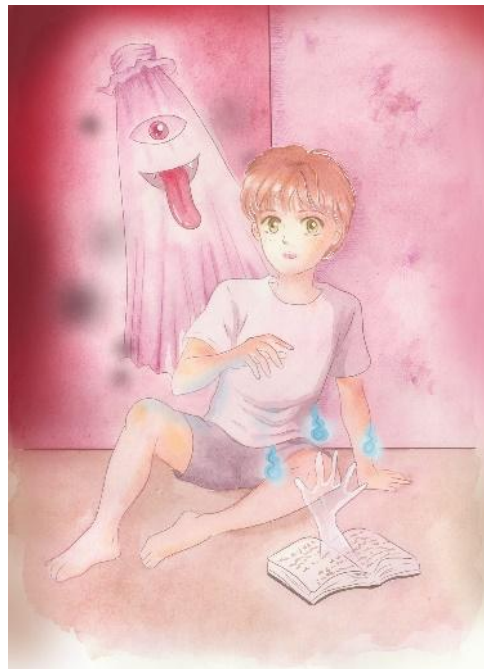
Illustration: Jan-Ole Sydow

Am 01.04.2026 ist der 11. Manga-Wettbewerb gestartet. Wir haben dafür das folgende Thema ausgewählt: